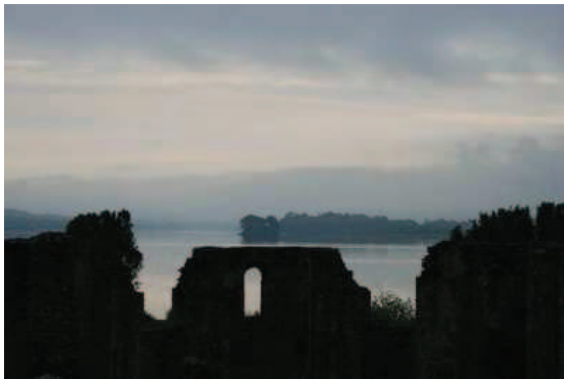
Vestiges de l'ancienne abbatale de Landévennec

L'ancienne abbaye de Landévennec est un lieu chargé d'histoire liée à la vie des moines. A la fin du V ème siècle, 12 moines s'installent au creux d'une boucle de l'Aulne, en pays de Cornouilles et y fondent une abbaye. Au X ème siècle les lieux sont détruits par un raid Viking et les moines sont contraints de fuir. Lorsqu'ils reviennent, ils reconstruisent l'abbaye qui prospère mais la Révolution française détruit l'ensemble des bâtiments. Dans les années 1950, l'abbaye reprend vie à quelques pas des ruines de l'édifice plus ancien.