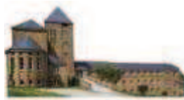
L'abbaye de Landévennec