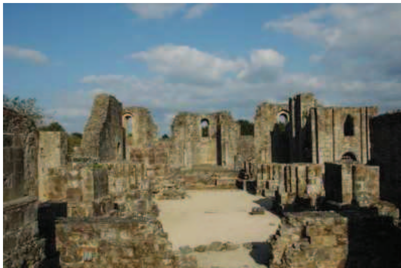
Vestiges de l'ancienne abbatale de Landévennec

Cette double exhortation, dans une mise en scène propre à chacune, en toute intensité et sobriété, sera témoin de la dramatisation de la Grâce sous forme d'une profération conduite jusqu'à épuisement du sens, comme le dit Claudel.