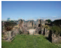
Vestiges de l'ancienne abbatale de Landévennec

L'ancienne abbaye de Landévennec, haut lieu du patrimoine artistique breton, accueille du 9 au 12 septembre, plusieurs créations scéniques et musicales sur le thème croisé du « Verbe sacré » avec la mise en valeur des textes d'Henri Meschonnic et de Paul Claudel