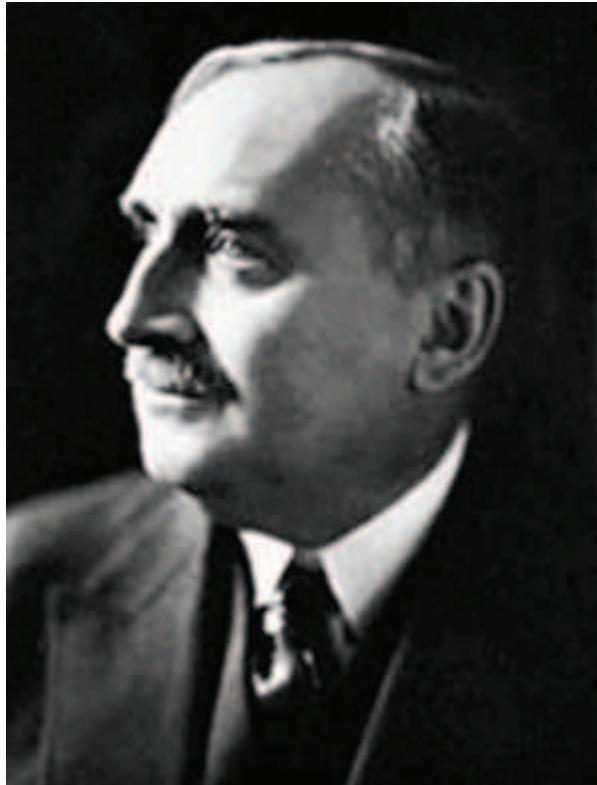
P. Claudel

Il y a quelqu'un qui m'a enfoncé les doigts aussi loin qu'il peut dans la bouche et je vomis. ... Mais qu'est-ce qui vient de t'arriver, ô David ? Voici que tout à coup au fond de toi, il t'est arrivé une autre voix ! une autre, pas la tienne. La tienne et pas la tienne. Ah ! quelle est donc, cette voix nouvelle, cette voix déchirante, insoutenable ? La mienne et pas la mienne ! » Paul Claudel